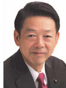
衆議院議員 武藤 容治様

協同組合NSK保険協会の皆様におかれましては、新年を健やかに迎えられましたこと、心よりお慶び申し上げますとともに、柔道整復師の地位向上をはかり、地域医療の一翼を担って業界全体の発展に寄与していただける協会役員はじめ会員、関係者皆様に対しまして深く感謝と敬意を表します。